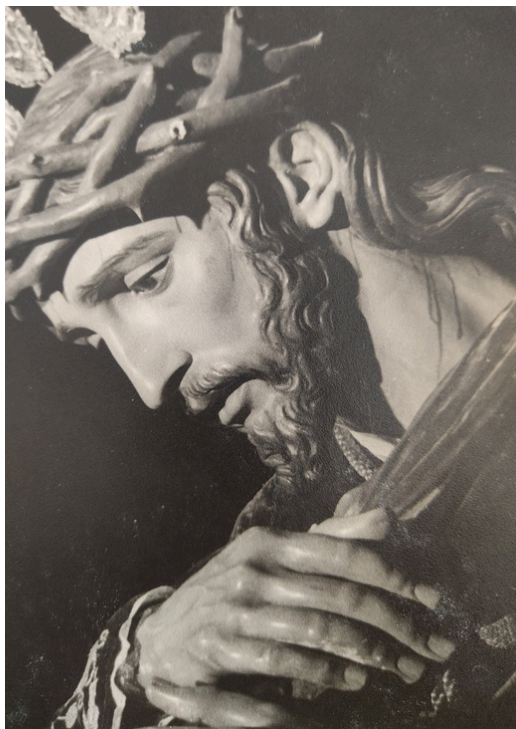
Ntro. Padre Jesús del Gran Poder, Montellano.