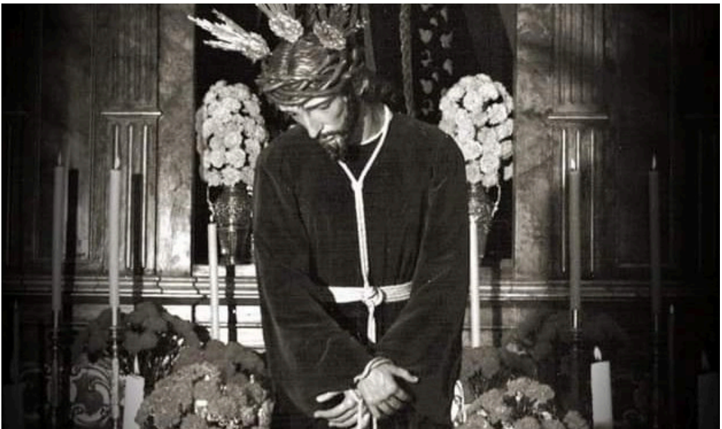
Contrato fechado a 1 de enero de 1938, firmado por ambas partes.

Y para que conste y se cumplan por ambas partes todas las condiciones escritas, firmamos el presente contrato por duplicado para los efectos en esta Ciudad fecha "ut supra".