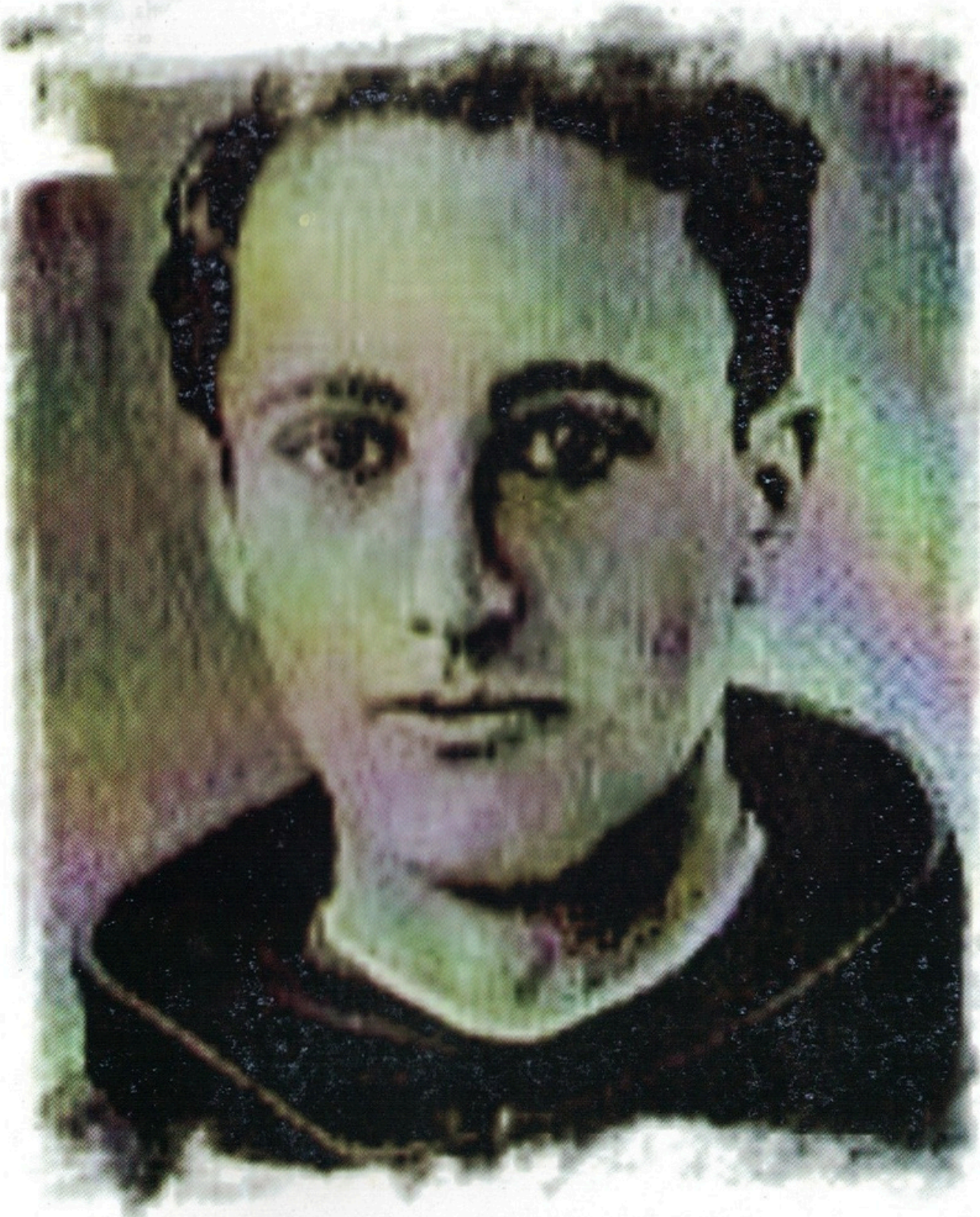
Beato Antonio Martínez Gil